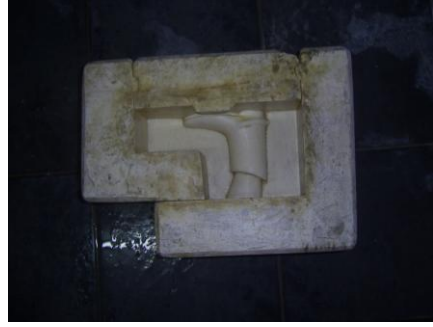
Resim 2.10: Çizme teksir kalıbı