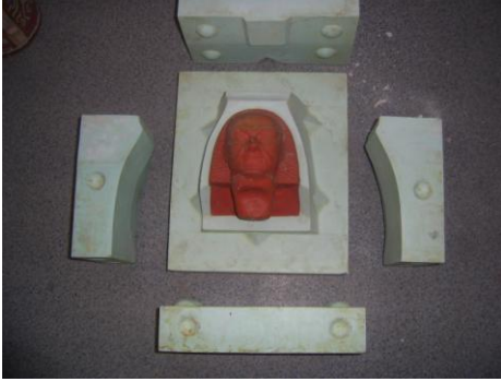
Resim 1.7: Teksir kalıbı ve yardımcı ceketler