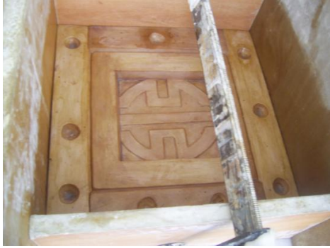
Resim 2.3: Kalıp kenarlarının sarılması