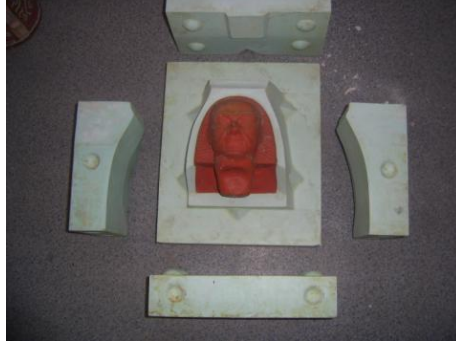
Resim 3.1: Araldit ve lastikten yapılan kalıp parçaları