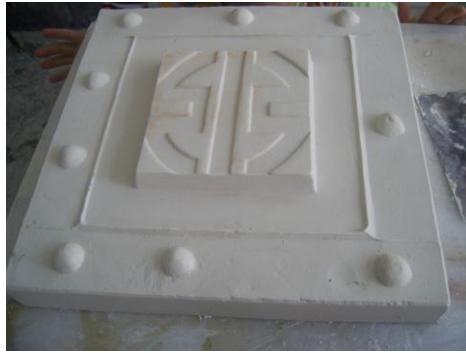
Resim 2.5: Blok dökümünün oluşturulması