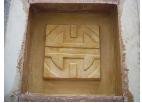
Resim 2.8: Teksir kalıbının birleştirilmesi