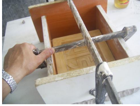
Resim 1.2: Yardımcı ceket için kalıp hazırlığı