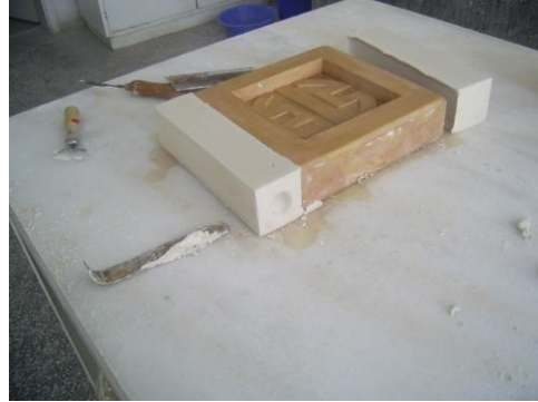
Resim 1.4: Yardımcı ceketler