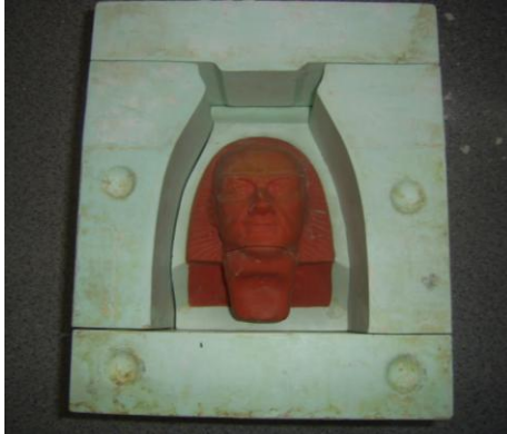
Resim 3.2: Araldit ve lastikten yapılan tek bir kalıp parçası