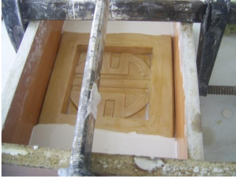
Resim 1.3: Yardımcı ceket dökümü