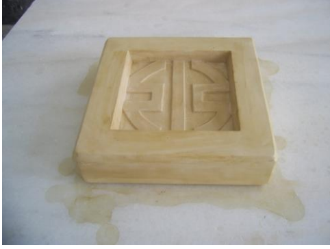
Resim 1.1: Model kalıp

Yardımcı ceket yapım örnekleri aşağıda resim 1.1, 1.2, 1.3, 1.4, 1.5, 1.6, 1.7 ve 1.8’de örneklendirilmiştir.