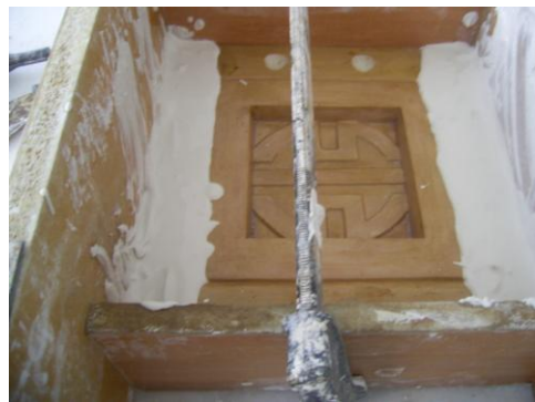
Resim 1.6: Yardımcı ceket dökümü