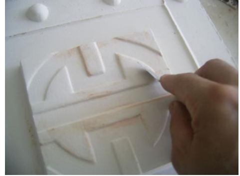
Resim 2.6: Kalıp iç yüzeyinin rötuşlanması