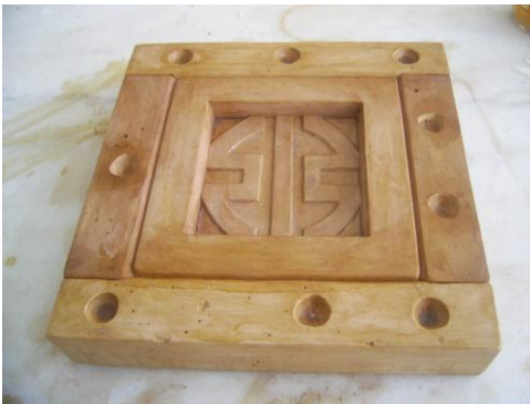
Resim 2.1: Yardımcı ceketli alçı kalıp

Blok dökümü yapım örnekleri aşağıda resim 2.1, 2.2, 2.3, 2.4, 2.5, 2.6, 2.7, 2.8, 2.9, 2.10'da örneklendirilmiştir.