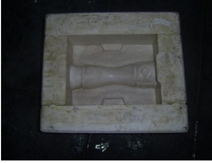
Resim 2.9: Vazo teksir kalıbı