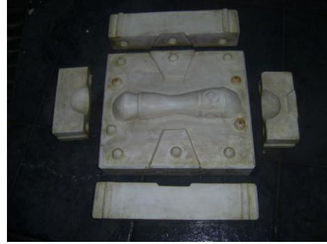
Resim 1.8: Vazo teksiri ve yardımcı ceketler