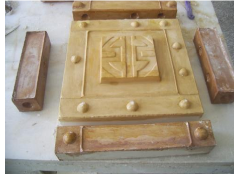
Resim 2.7: Teksir kalıpların gomalakla yalıtılması