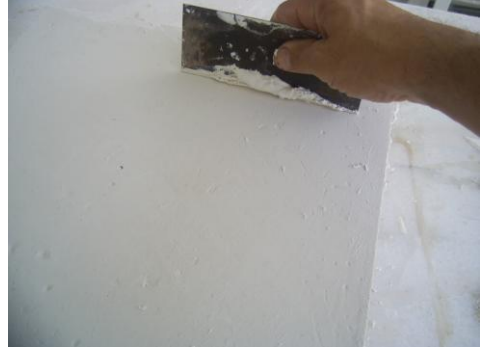
Resim 2.4: Dökülen bloğun üst yüzeyinin düzeltilmesi