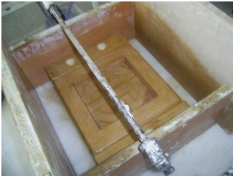
Resim 1.5: Yardımcı ceket için kalıp hazırlığı